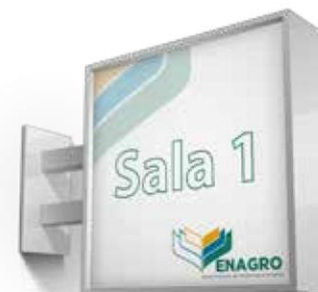
Placa de sinalização