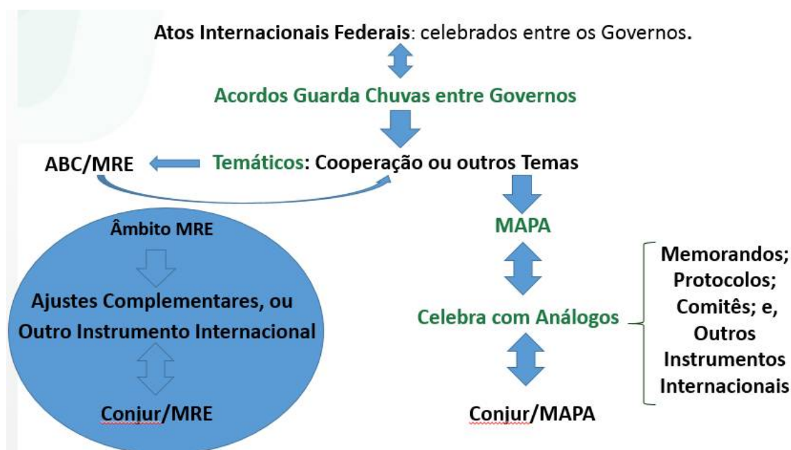
Figura: Cooperação no âmbito federal – atuação da SRI

Neste contexto, em 2016 foram desenvolvidas pelo DPI/SRI/MAPA tratativas de Cooperação Internacional com diversos países, blocos comerciais e organismos internacionais, o que representa mais de 125 Protocolos Administrativos , conforme apresentado em maior detalhes a seguir.