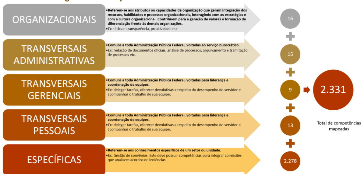
Quadro 1 – Categorias de competências

As competências organizacionais já existiam, porém foram revisadas pela UFPA e submetidas para validação da ENAGRO e da Coordenação-Geral de Planejamento (CGPLAN/DA).